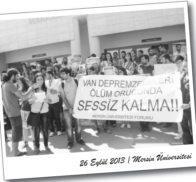
26 Eylül 2013 | Mersin Üniversitesi

Gençlik üniversitelerde mücadeleyi yükseltmeye devam ediyor. Mersin, Ankara, İzmir ve İstanbul'da çeşitli yaptığı eylemlerle sözünü söylüyor.